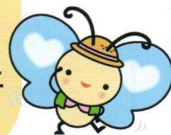
札幌市介護予防センターキャラクター 「かよるん」